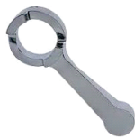
ALAVANCA DA VÁLVULA REGULADORA