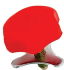
BOTÃO REGULADOR COM TRAVA