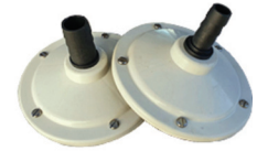
FILTRO SUCCÃO NACIONAL PL