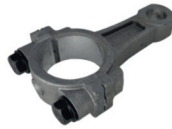
BIELA 22,30 E 40