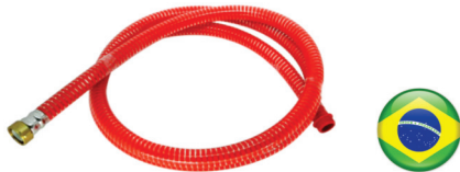
MANGUEIRA SUCCÃO NACIONAL 22, 30 E 40