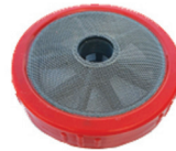
FILTRO SUCCÃO NACIONAL IMPORTADO COD: 4026