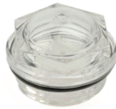
NÍVEL DE ÓLEO