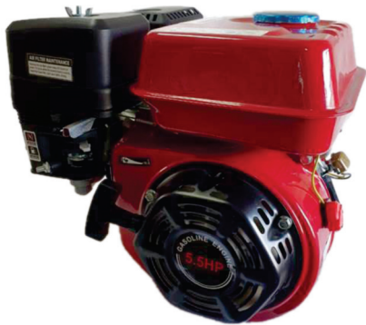
MOTOR ESTACIONÁRIO 5,5HP